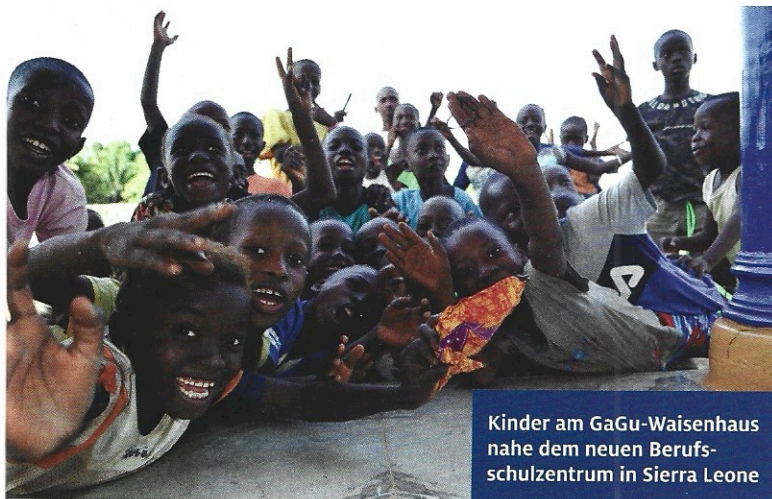
Kinder am GaGu-Waisenhaus nahe dem neuen Berufsschulzentrum in Sierra Leone

Zu wenig Wasser aus dem Niederschlag bedeutet Ernteauffälle und höhere Preise für Obst und Gemüse. Zwar müssen wir uns noch nicht sorgen, dass kein Wasser mehr aus