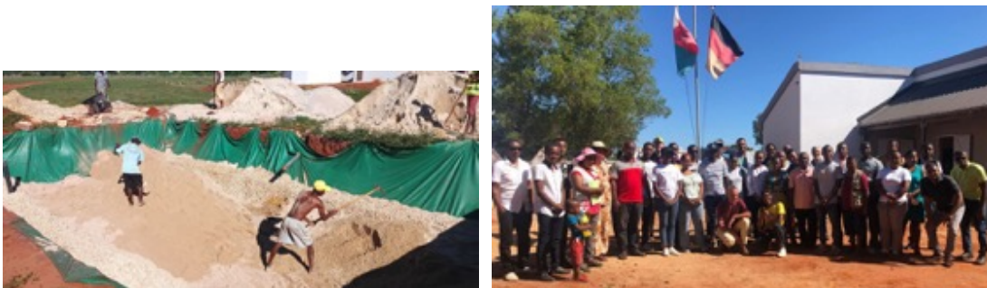
(Bau des Verdunstungsbeetes und Teilnehmer am Workshop in Andranovory)